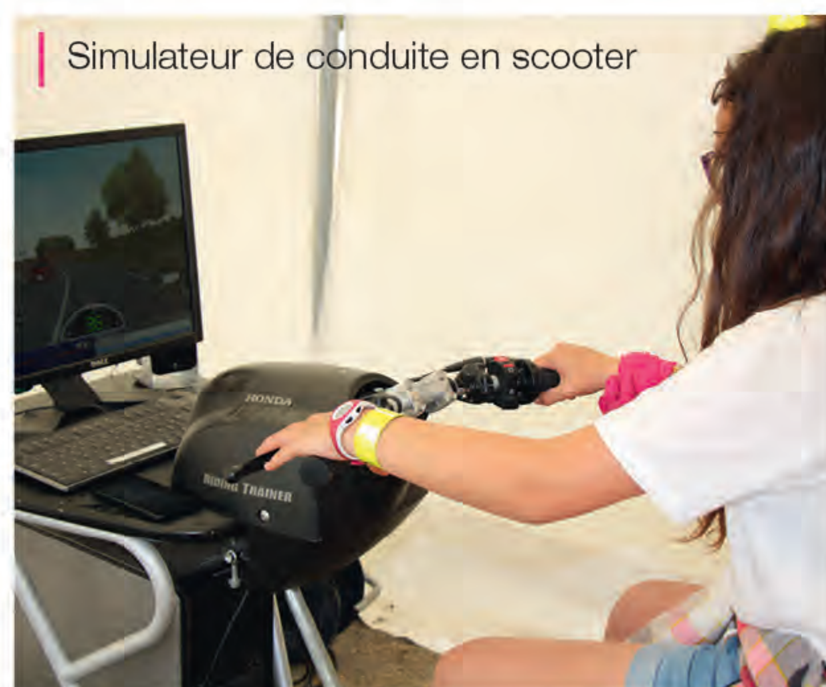
Simulateur de conduite en scooter