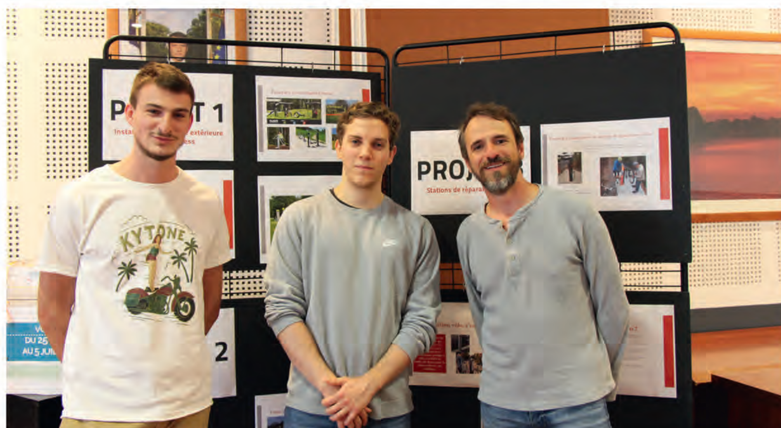
Les porteurs de projets

Les résultats des votes : une année sportive !