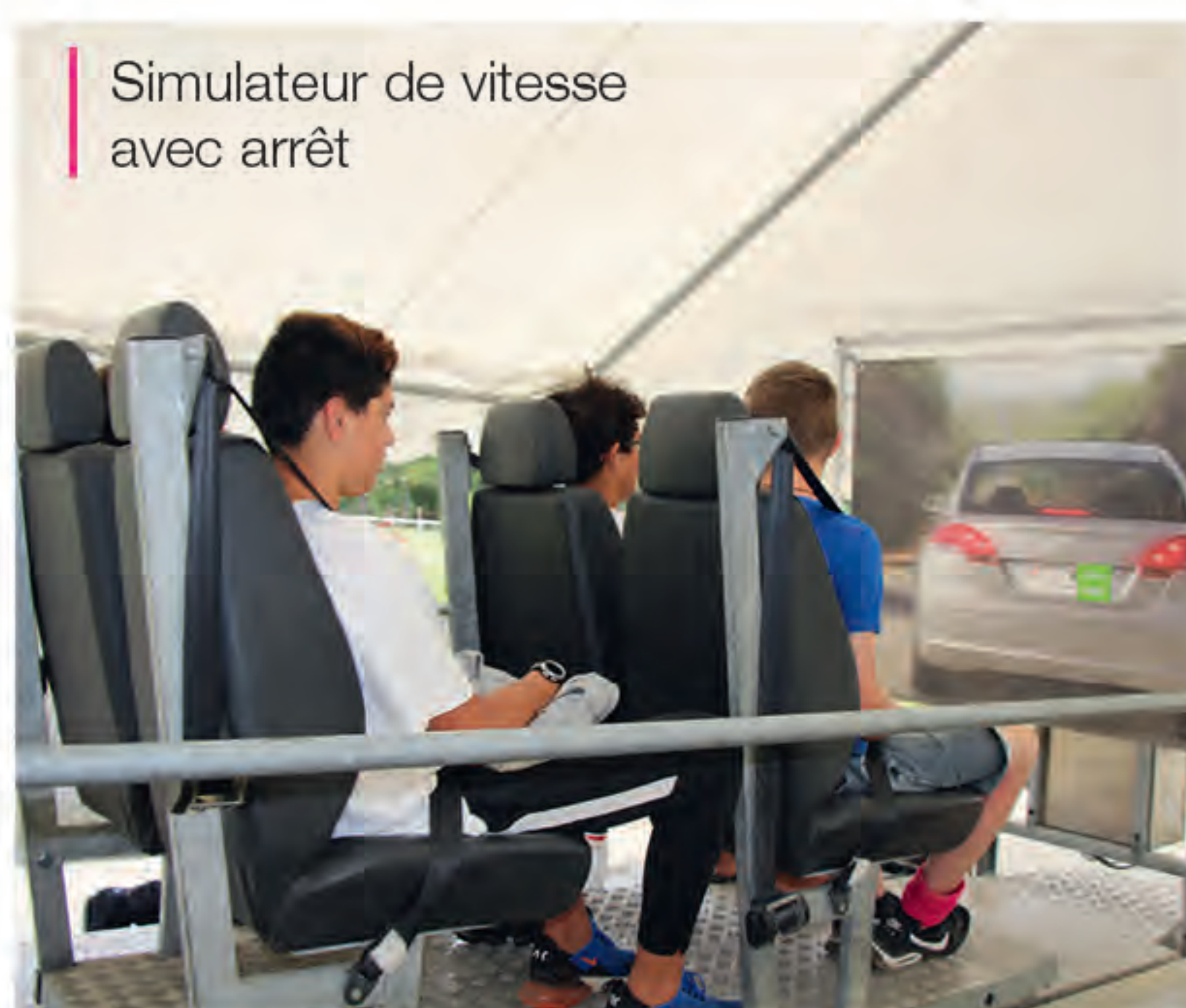
Simulateur de vitesse avec arrêt

L'équipe œuvre au quotidien pour accompagner les jeunes dans leur développement et leurs apprentissages. Les animateurs mènent de nombreuses actions et se forment au quotidien pour répondre à leurs problèmes :