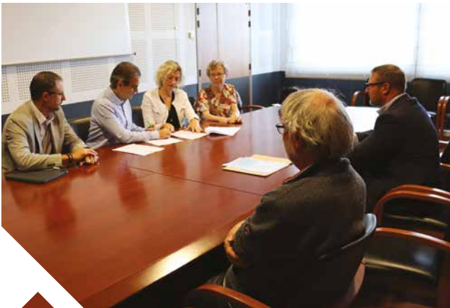
Signature de la convention

La municipalité de Theix-Noyalo a décidé de faciliter l'accès aux mutuelles à prix raisonnable pour ses administrés en signant une convention avec les groupes Axa et Groupama. La mise en place de ce partenariat permet aux habitants de bénéficier de conditions tarifaires plus intéressantes que s'ils avaient effectué des démarches individuelles.