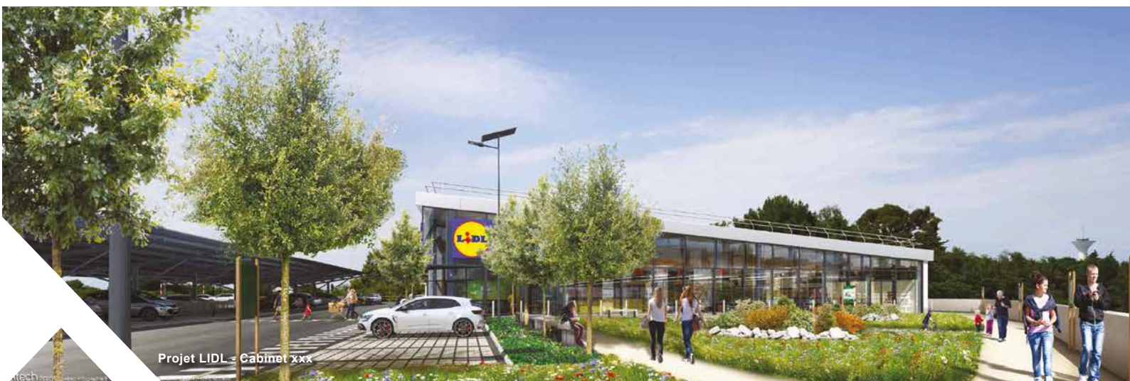
Projet LIDL - Cabinet xxx