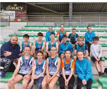
Quelques jeunes du club Athlé-Theix avec leur entraîneur

Oui en effet, nous avons beaucoup échangé lors de réunions. Nous avons réussi à obtenir un équipement qui conviendra à nos usages. Nous pourrions accueillir des compétitions au niveau départemental dans de meilleures conditions.