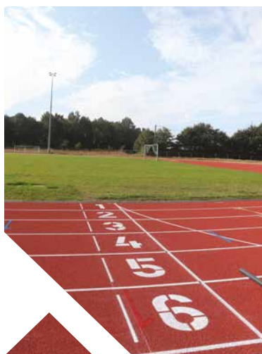
La nouvelle piste du club d'athlétisme