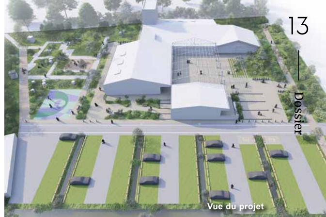
Vue du projet

Cet équipement est en cours d'élaboration technique en collaboration avec le cabinet d'architecte retenu STUDIO O2. Il prend en compte la dépollution du site, héritage du passé, et répondra aux obligations environnementales, en particulier la préservation des espèces protégées par des mesures compensatoires (nichoirs, cabanes à oiseaux, pierretts pour les lézards...).